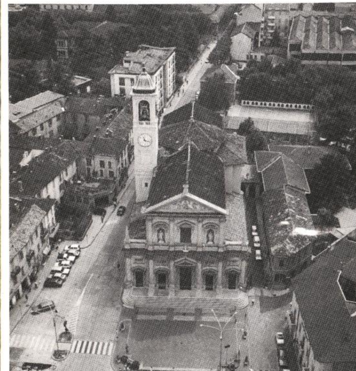
La Chiesa Prepositurale dei SS. Pietro e Paolo in Saronno "aggregata alla Basilica Vaticana"

Nel 1992 il coro, che era di S. Francesco vi è stato riportato ed un nuovo coro ha preso il suo posto.